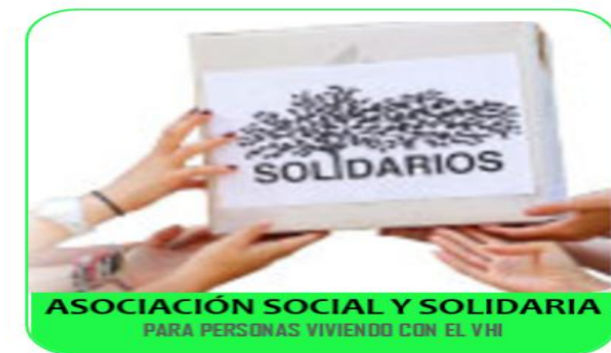
Figura 6 Logotipo y Marca de la Asociación Social y Solidaria

A continuación presento la Marca o logotipo con la que se trabajará: