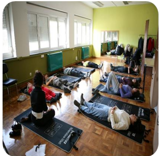
Figura 2 Taller de Relajación

Con el desarrollo de estos talleres, como la relajación muscular progresiva, meditación, también la hipnosis y el entrenamiento autógeno, empleados en el tratamiento de diversas afecciones relacionados con la tensión, tal como el insomnio, la hipertensión esencial, dolores de cabeza por tensión, el asma bronquial y la tensión general. Asimismo los métodos de relajación se utilizan como tratamiento coadyuvante en diversas situaciones, tal como la ansiedad de hablar en público, las fobias, el frecuente síndrome de colon irritable, el dolor crónico y las disfunciones sexuales, entre otras afecciones.