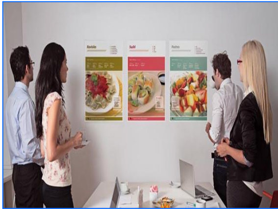
Figura 4 Taller de Nutrición

Luego los involucrados preparan deliciosas recetas sencillas que pueden hacer en casa para motivar a sus familias a probar nuevas formas de alimentarse. 65