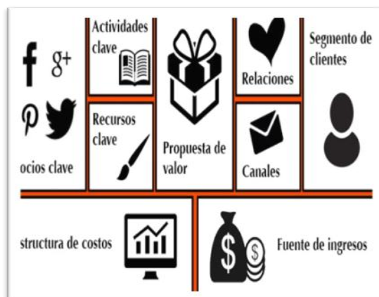
Figura 5 Modelo Canvas

Elaboración y desarrollo de un proyecto emprendedor a partir de experiencias