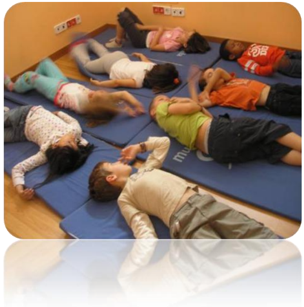
Figura 3 Taller de Niños

Desarrollamos distintas actividades dirigidas a los chicos en diferentes temas para lograr su fortalecimiento social. 64