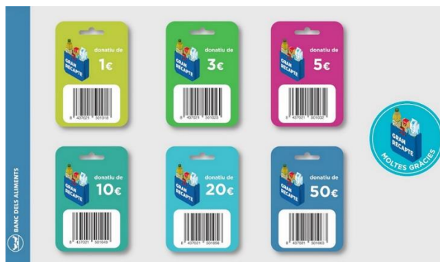
Campanya de recaptació a partir de donacions. FBA (El Gran Recapte Virtual)

“El gran recapte es va fer amb format diners, la gent anava als ‘supers’ i comprava 10 euros del que sigui, llavors, després els mercats tenien un coixí de diners i llavors els bancs dels aliments poden comprar els aliments a lo llarg de l’any (...) aquells diners només es poden fer servir en aquells supermercats, hi ha que ens guarden els diners per més temps i hi ha que ho has de comprar de seguida, aleshores, torna a ser producte sec que es pugui conservar” (P1).