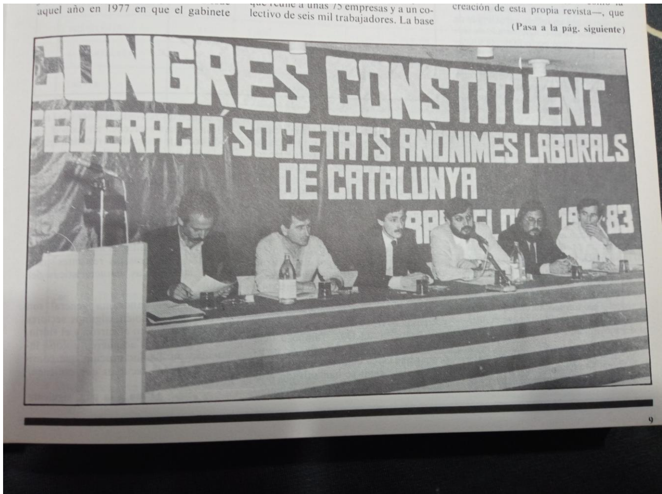
Foto: Congrés Constituent FESALC 19 de juny 1983