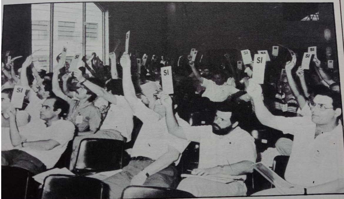
Un momento de las votaciones