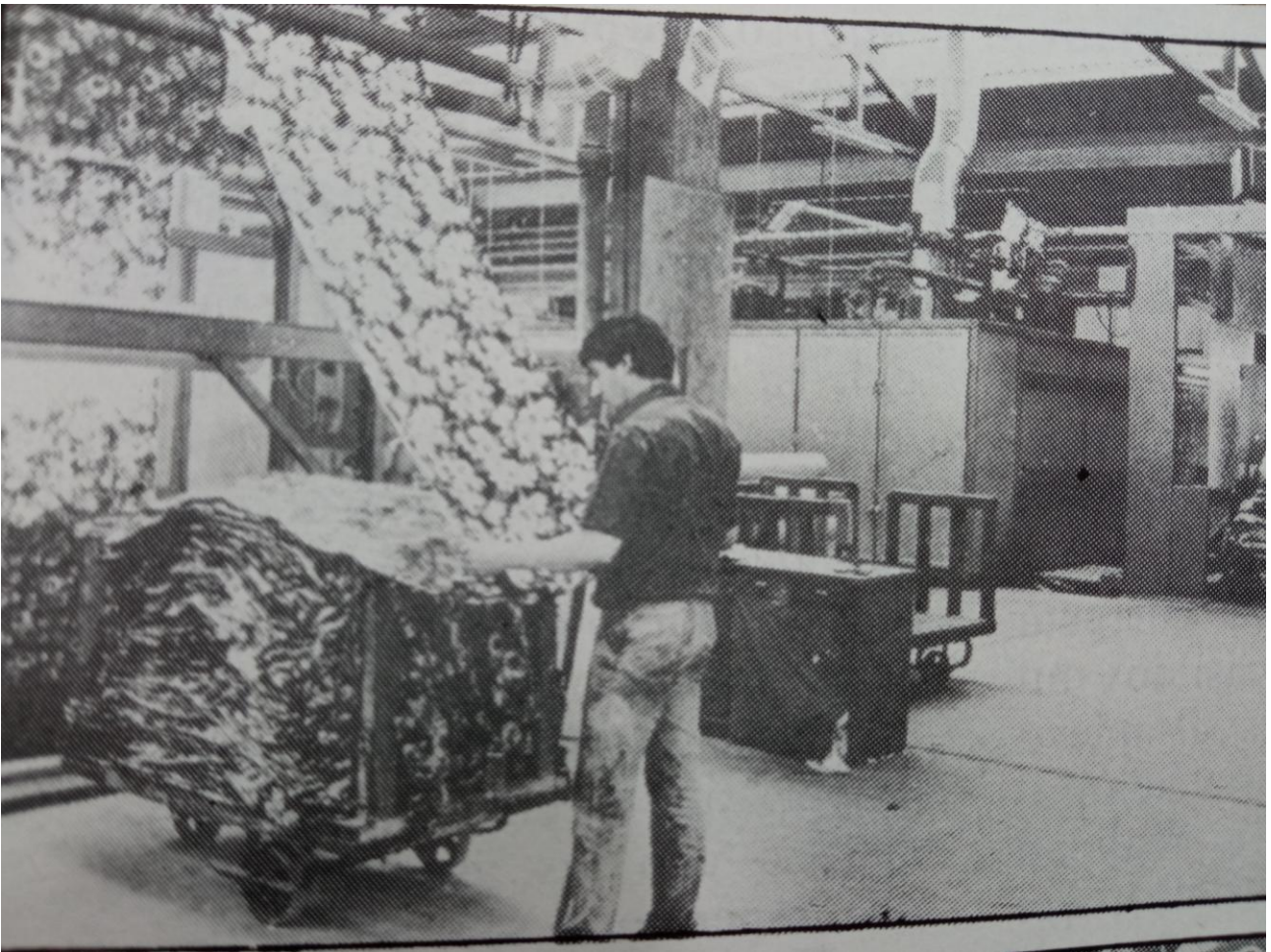
Foto 5. Procés productiu fàbrica acabats tèxtil SAL