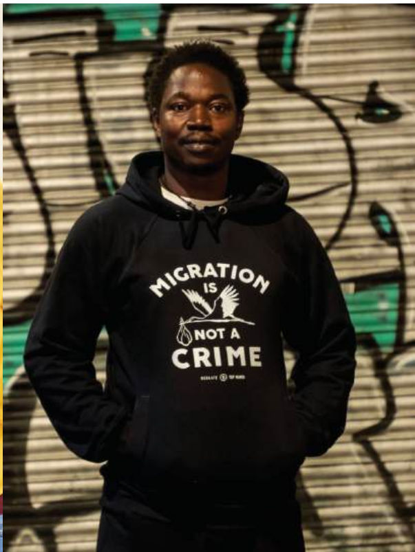
Fotografies preses de la pàgina web de Top manta, marca social i solidària impulsada pel Sindicat de Venedors Ambulants de Barcelona: www.topmanta.store