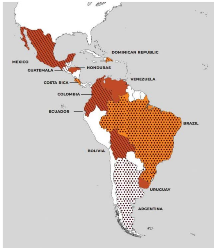
Figura 3. Mapa representatiu de la situació de l'ESS en la regió llatinoamericana i del Carib