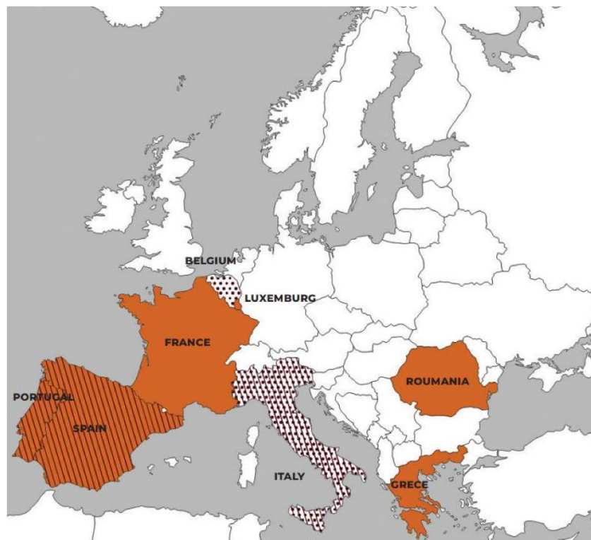
Figura 7. Mapa representatiu de la situació de l'ESS en la regió d'Europa i Àsia Central