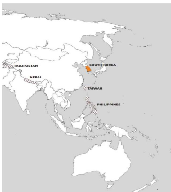
Figura 6. Mapa representatiu de la situació de l'ESS en la regió d'Àsia i el Pacífic