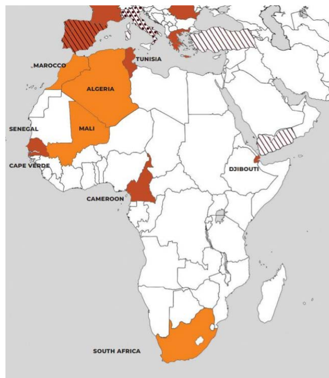
Figura 2. Mapa representatiu de la situació de l'ESS en la regió africana