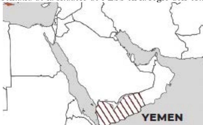
Figura 5. Mapa representatiu de la situació de l'ESS en la regió dels estats àrabs