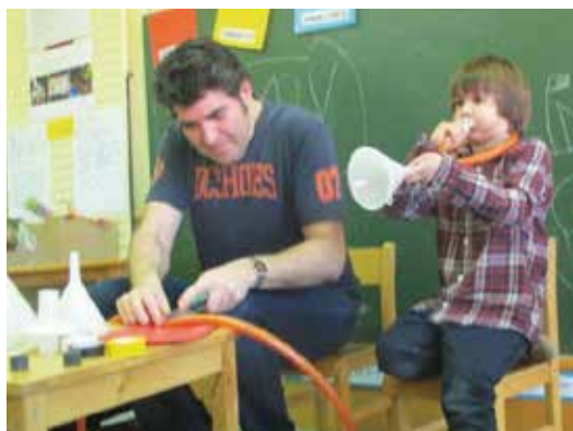
Escola el Puig, SCCL

EL PUIG, SCCL: «Per ser soci has de comprar dos títols, cada família ha de tenir dos títols. És una aportació retornable.»