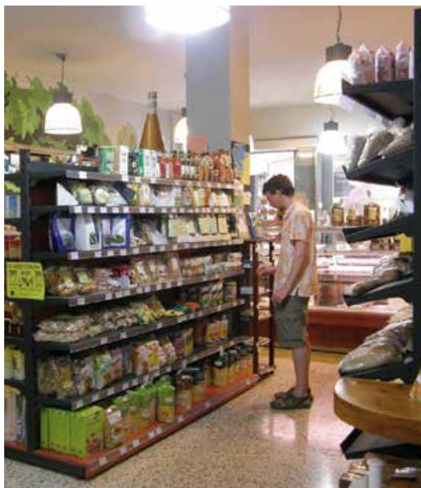
El Brot, SCCL