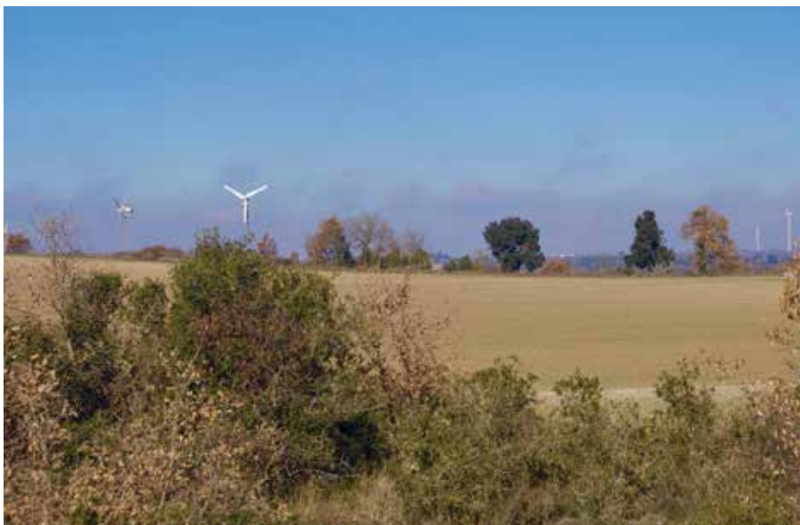
Som Energia, SCCL

«En termes econòmics, el risc el porta la comercialitzadora, perquè als consumidors se'ls estableix un preu fix. El mercat elèctric és molt variable; per a petits consumidors és molt complicat ser competitius. Es fan previsions de preus anuals, i a partir d'aquí es determina un preu fix per als consumidors. Som Energia aposta per la seguretat, i posa preus que no són els més baixos del mercat, però tampoc no són els més elevats.»