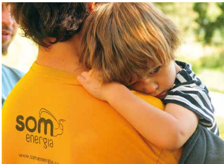
Som Energia, SCCL