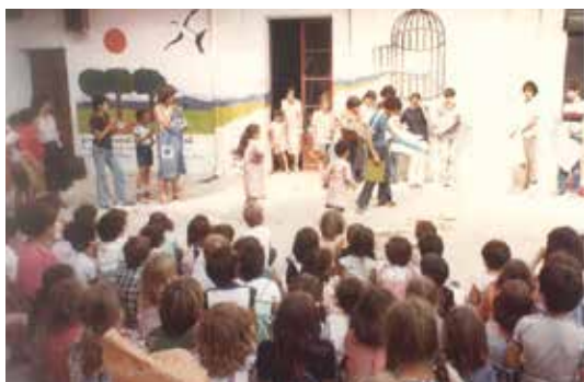
Escola el Puig, SCCL

EL PUIG, SCCL «Un grup de pares que eren activistes, vinculats a partits polítics i moviments socials, no volien l'escola que hi havia per als seus fills. Era 1970, volien una escola que fos catalana, que fos laica, que fos de nens i nenes, i que fos activa. Van decidir que el model d'escola tradicional no els agradava. A partir d'aquí, van començar una feina prèvia d'investigació, coneixien Rosa Sensat, tot el moviment de renovació pedagògica, i van buscar mestres per desenvolupar el projecte pedagògic. L'escola va començar amb la classe de dos anys i va anar creixent. En aquella època era molt trencador, amb molts ulls que et miraven i que qüestionaven la feina. Era una nova manera d'ensenyar també. No hi havia llibres de text, les coses s'aprenien molt més des de l'experimentació, sempre que es podia se sortia fora, a la natura, per fer les classes.»