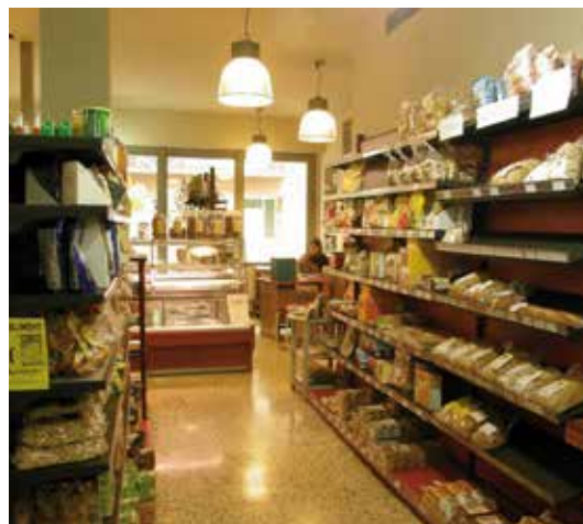
El Brot, SCCL