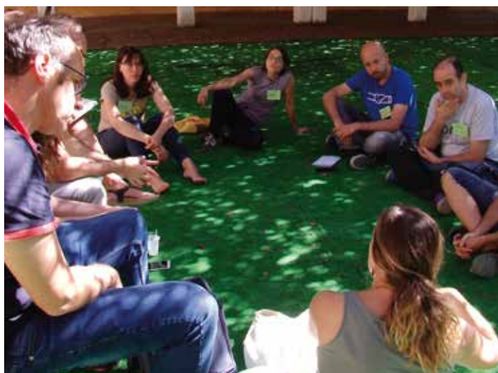
Som Energia, SCCL