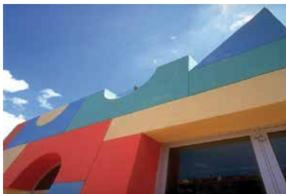
Escola el Puig, SCCL

El capital social d'una societat cooperativa està constituït per la suma de les aportacions subscrietes per les persones associades, de tal manera que, en la mesura en què aquestes es donen d'alta i de baixa en funció de la participació o no en la cooperativa, es tracta d'un capital social variable. Aquesta variabilitat per naturalesa provoca que no sigui necessari formalitzar davant de notari cada variació de capital, com sí que passa en altres formes jurídiques mercantils.