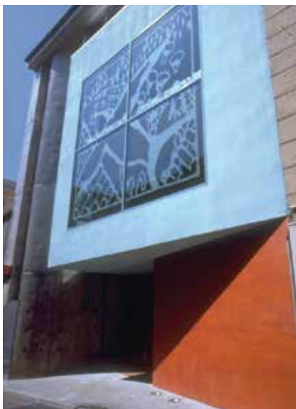
Escola el Puig, SCCL

la seva responsabilitat en aquest cas es limita a la possibilitat de no recuperar el capital social.