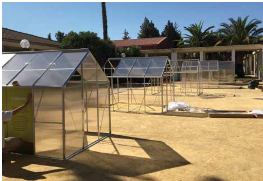
Som Energia, SCCL

d) En empreses mercantils, és normal fer anàlisi del mercat per esbrinar com fer-nos un lloc, com diferenciar-nos o què valoren els consumidors en el sector. Però a la CCU, d'alguna manera partim amb avantatge: partim de necessitats expressades col·lectivament pels membres.