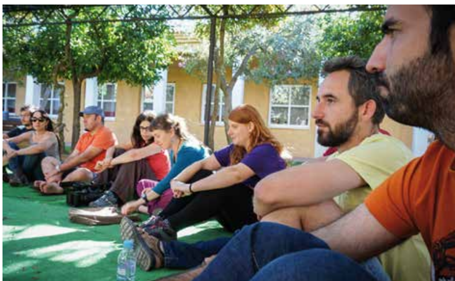
Som Energia, SCCL

EL BROT, SCCL «Tenim una comissió que és compravenda i qualitat. És sobre què hi ha d'haver al prestatge. Per exemple, vam decidir no ser herboristeria, però tot i així tenim quatre suplementes, olis o herbes d'infusió. També treballen la relació amb els pagesos, proveïdors, valorar minves i estocatge, i nous productors.»